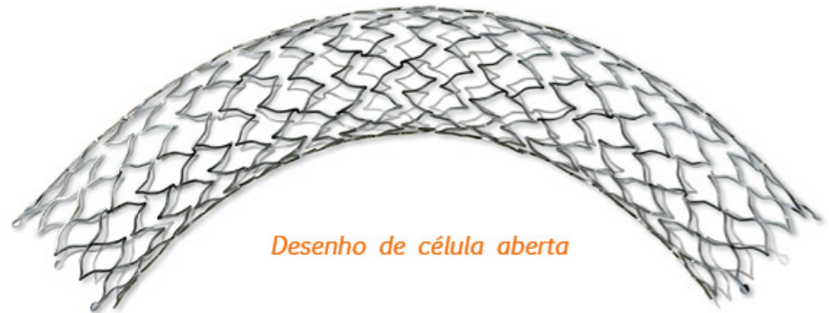
Desenho de célula aberta